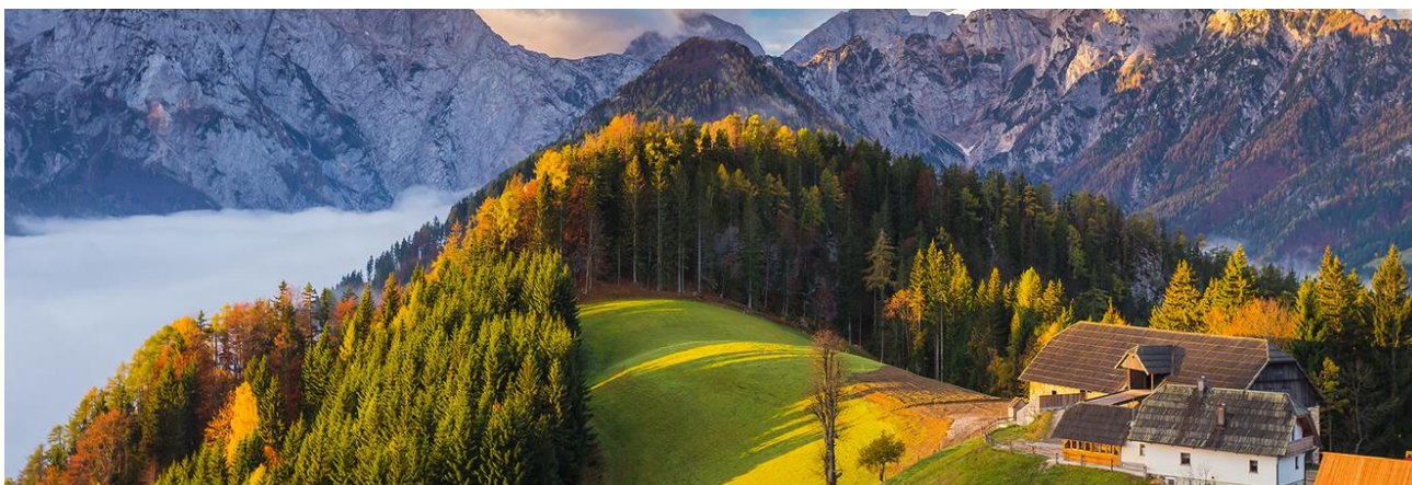
Slika: Logarska dolina s Solčavske gorske poti – zahtevne naravne okoliščine

Potreba po učinkoviti uporabi vseh virov, naravnih in človeških, je najverjetneje prispevala tudi k razvoju organizacijskih in upravljaljskih oblik, kot so bile na primer agrarne skupnosti. Ohranile so se le še v omejenem obsegu, slabo jih poznamo.