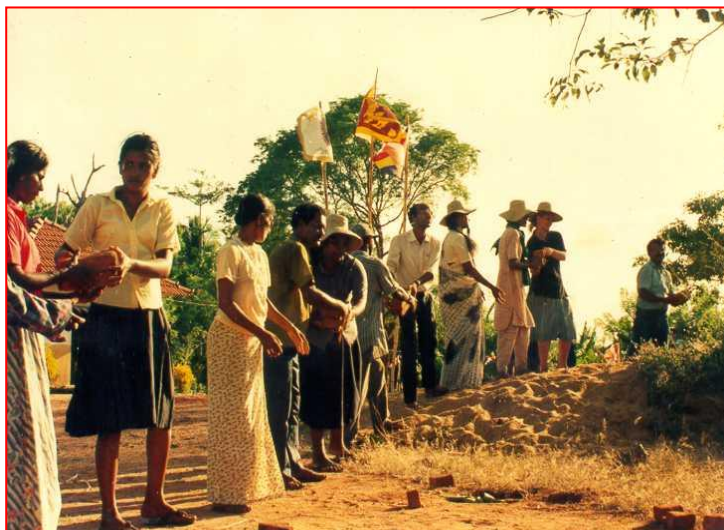
Slika: Vaščani si s skupnim delom, ob pomoči Sarvodaye, izboljšujejo pogoje za življenje

Program Sarvodaya se začne s povabilom iz vasi na razpravo o tem, kaj vas potrebuje in kako je to mogoče zagotoviti. Osebe Sarvodaye nato pomaga vaščanom organizirati tabore, v okviru katerih s skupnim delom zgradijo na primer ceste, vodovod in zadovoljijo še druge nujne potrebe. Postopno nadaljujejo z oblikovanjem vaškega sveta, izgradnjo šole in klinike, vzpostavljanjem družinskih programov, ustvarjanjem gospodarskih priložnosti, tako da bo vaško gospodarstvo postalo samozadostno, odprlo vaško banko in ponudilo pomoč drugim vasem.