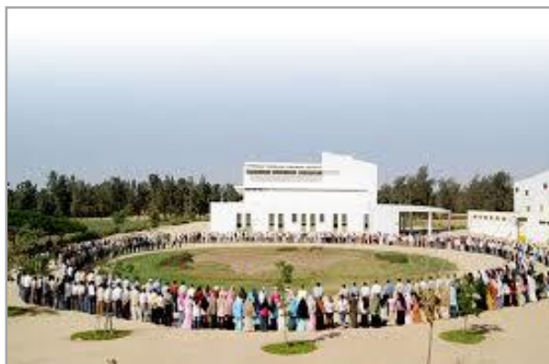
Slika: Enkrat tedensko se vsi člani skupnosti SEKEM-a zberejo v krogu