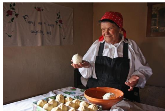
Slike: Lokalna samooskrba (zgoraj) in rokodelstvo (desno) kot pomembni dejavnosti v razvojnem modelu Srca Slovenije (logotip spodaj) (povzeto po predstavitvah RC Srca Slovenije)