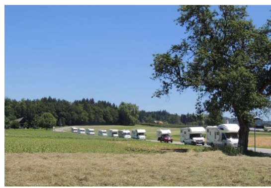
Tradicionalne in nove dejavnosti v turizmu Srca Slovenije (v smeri urinega kazalca, začenši zgoraj levo): oglarstvo, kolesarjenje, pustolovski park, karavaning (povzeto po predstavitev RC Srca Slovenije)