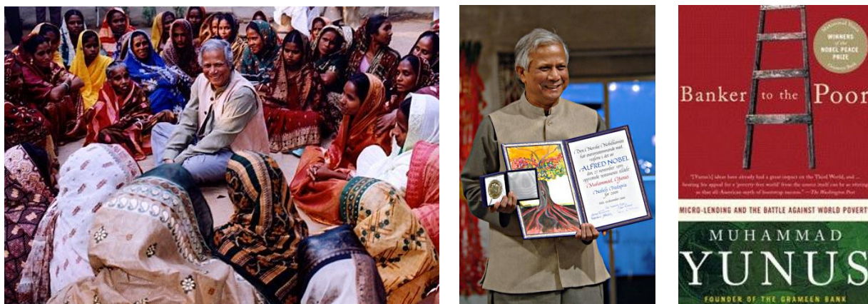
Slike: Dr. Muhammad Yunus na srečanju z ženami in ob prejemu Nobelove nagrade 3 , naslovnica njegove avtobiografije Banker to the Poor 4 .

Nobelov nagrajenec, ekonomist Muhammad Yunus , ustanovitelj Banke Grameen (leta 1977) in utemeljitelj novih pristopov v bančništvu, je leta 2012 ob obisku v Sloveniji opisal, kako so z mikrokrediti uspeli zmanjšati revščino v Bangladešu (namesto moškim so denar dajali ženskam) in kako lahko z ustanavljanjem socialnih podjetij odpravimo brezposelnost 1 . Zaključil je: »Vse to je mogoče, če začnemo razmišljati v obratni smeri.« 2