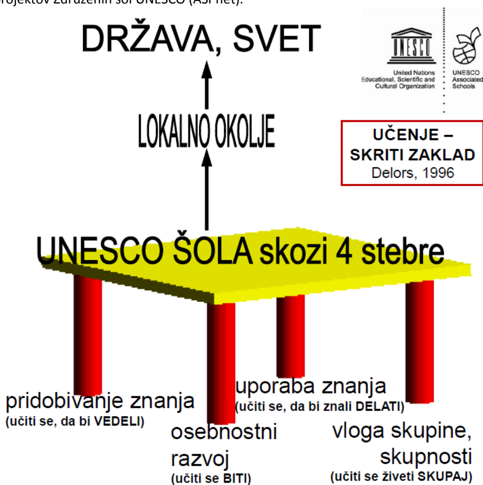
Slika: UNESCO šola skozi štiri stebre (predstavitev UNESCO šol, delovno gradivo)

Ti štiri stebri, ki jih UNESCO šteje kot temeljne za globalno zahtevano preoblikovanje izobraževanja, kažejo presenetljivo resonanco z integralnim modelom bivanja (v skupnosti), postajanja, védenja in delovanja (Schieffer in Lessem, 2014). Prevod štirih stebrov v dobre prakse kakovostnega izobraževanja je eden ključnih ciljev mreže projektov Združenih šol UNESCO (ASPnet).