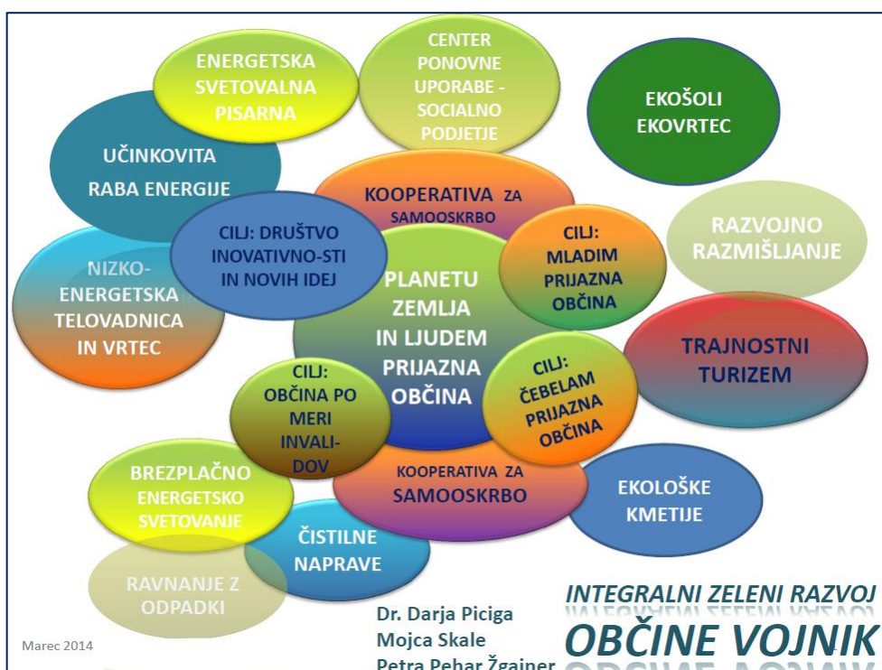
Slika: Integralni model Občine Vojnik iz leta 2014

V okviru pobude za Integralno zeleno Slovenijo se nismo toliko posvečali razvoju socialnih inovatorjev, posameznih nosilcev dobrih praks, kot je to značilno za delo Centra za integralni razvoj Trans4m 5 - ključni akterji pobude niti nismo želeli nastopati s svojimi osebnimi zgodbami, ampak smo se poleg konceptualnega snovanja in gradnje politik (v pomenu »policy«) osredotočili bolj na odkrivanje, razlago in povezovanje dobrih praks. Seveda se zavedamo, da smo lahko v knjigi Integral Green Slovenia in v Integralni seriji smo omenili, predstavili in integralno osvetlili le majhen del trajnostno razmišljujočih in delujočih posameznikov, timov, skupnosti ..., ki jih imamo v Sloveniji ali je pri njih mogoče odkriti slovenske korenine. Nekateri so v preteklih letih nastopili na dogodkih Integralne zelene Slovenije, pa se naše sodelovanje ni razvilo do prispevka v knjigi. Naj omenim le na tradiciji znane domačije Grčin »zraslo« družino vrhunskih sokov Jabolčnik 6 - njihovo zgodbo smo spoznali marca 2014. Na istem posvetu 7 smo slovenske dobre prakse začeli predstavljati z integralnimi modeli štirih svetov in moralnega jedra. Poleg Solčavskega in Srca Slovenije tudi Občino Vojnik – njihov integralni model je na spodnji sliki, celotna predstavitev na tej povezavi .